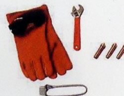
#6020, #6022, #6021, #4020 耐熱手袋、ゴーグル、レンチ、 3-ウェイライターならびにチップ