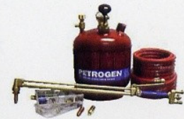
ペトロゲン標準セット