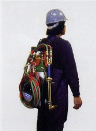
携帯することが可能